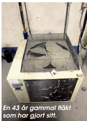
En 43 år gammal fläkt som har gjort sitt.