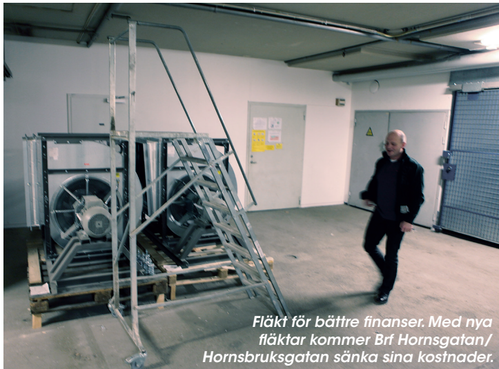
Fläkt för bättre finanser. Med nya fläktar kommer Brf Hornsgatan/Hornsbrugsgatan sänka sina kostnader.